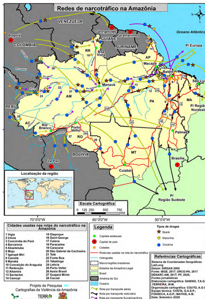
Figura 1 - Redes de narcotráfico na Amazônia brasileira

A violência, como aponta Medeiros, é um elemento recorrente nas diversas formas de mobilização dos trabalhadores do campo, sendo “na luta por terra que ela tem se mostrado mais conflitante e intensa” (Medeiros, 1996, p. 9). Essa constatação revela a persistência de conflitos agrários no Brasil ao longo dos séculos, destacando-se especialmente na Amazônia Legal, onde os problemas se ampliam na atualidade. Na região norte, ações violentas têm sido atribuídas predominantemente a grileiros, madeireiros e garimpeiros. Contudo, o próprio Estado brasileiro também se mostra envolvido em cerca de um quinto dos casos de violência registrados, especialmente na esfera federal, evidenciando a intensificação dessas ações em detrimento de grupos sociais vulneráveis, seja por meio de consórcios público-privados ou, no mínimo, por (Porto-Gonçalves et al. , 2021).